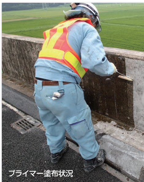
プライマー塗布状況