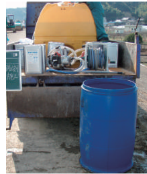
希釈用タンク ポリタンク、空ドラムなど