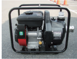
エンジンポンプ 吐出量：500～600L/min程度