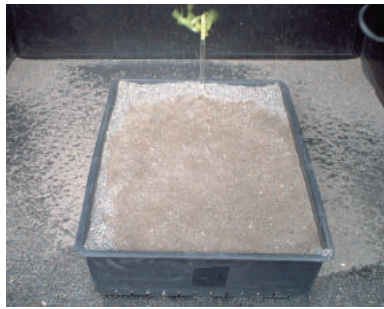
風洞試験の様子(無処理試料)