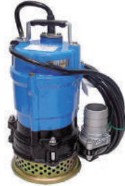
水中ポンプ 吐出量：100～600L/min程度