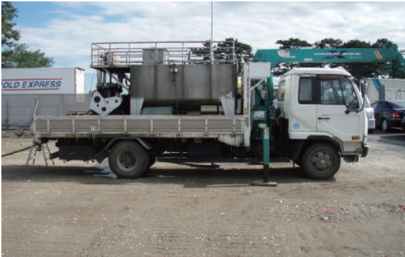
ハイドロシーダー(種子吹付機)