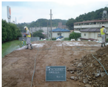
工事用道路(非通行部)